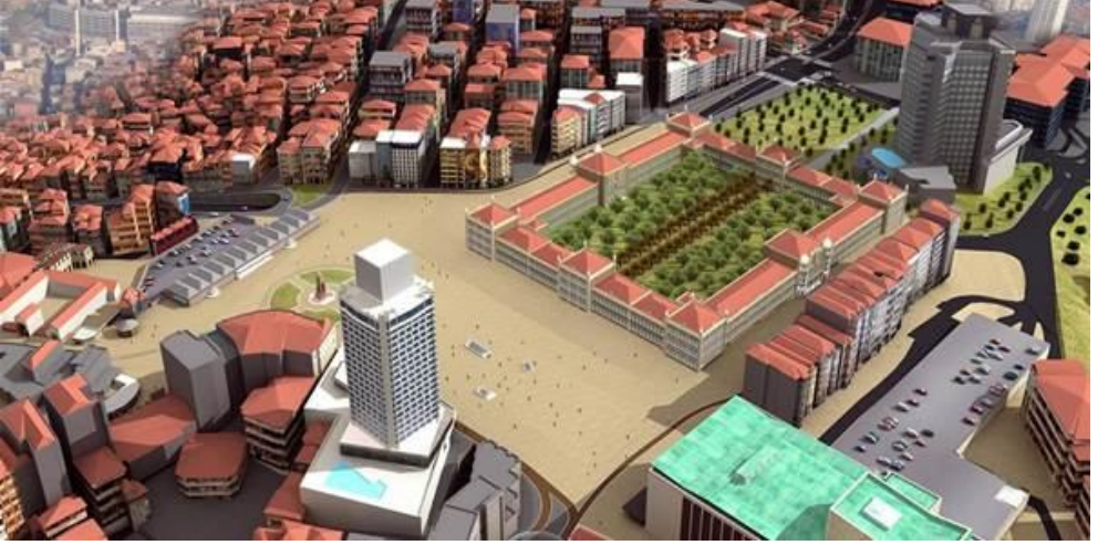
Resim. Taksim Yayalaştırma Projesi modellemesi, İBB Resmi web sitesi

Sadece iç hukukumuz değil aynı zamanda 20 Ekim 2000 tarihinde ülkemizde de imzalanmış olan Avrupa Peyzaj Sözleşmesi 6 de, tarihi ve kültürel miras değerlerini, uluslar arası önemde korumayı zorunlu kılacak taahhütleri içermektedir. Sözleşmenin 5. maddesi, Genel Tedbirler bölümünde ise sözleşmeyi imzalayan her bir taraf peyzajları, yasayla, insanların çevrelerinin önemli bir bileşeni, onların paylaştıkları kültürel ve doğal mirasın çeşitliliğinin bir ifadesi ve kimliklerinin bir temeli olarak tanımayı taahhüt etmektedir.