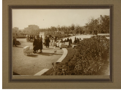
Resim. Parkta gezinti yapan, çocuklarını gezdiren insanlar

Her türlü yasal-yönetmelik durumlara, hukuki ve bilimsel gerekçelere ve toplumsal itirazlara rağmen iktidarın söz konusu projeyi hayata geçirme çabası içerisinde birçok süreci barındırmaktadır;