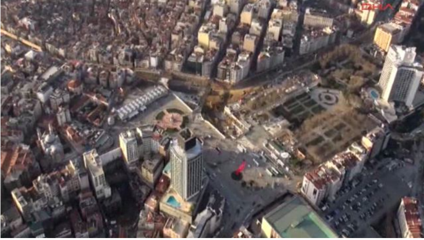
Resim. Taksim Meydanı'nın son hali, 7 Mart 2013

kayıt edilmeyen alanlar için yukarıda belirtilen kayıt konulmaz' hükmü getirilmiştir.