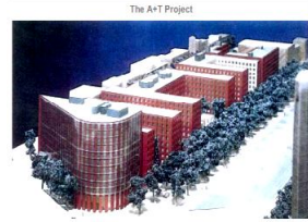
Şekil Özel şirketlerin kendi yapıları ve sokakları (Frank, 2003).

Bu proje, çok amaçlı kullanıma sahip, gece gündüz yaşayan, alışveriş birimleri, 3500 kişilik sinema salonu, tiyatro gibi kültürel yapılar, restoranlar, kafeler, üst ve orta sınıfa hitap edecek konut alanları vb çok fonksiyonlu kentsel alan yaratımını sağlayacağına (Şişman, 2009) gibi söylemlerle meşrulaştırılmaya çalışılmıştır.